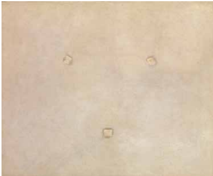
Antoni Tàpies, Tres marques sobre blanc , 1962. Tècnica mixta sobre tela, 81 x 100 cm.