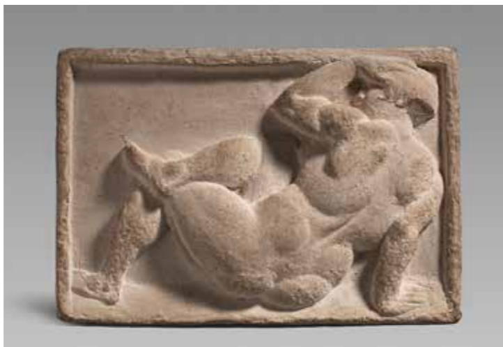
Manolo Hugué, Femme assise , 1930. Rellu de terra cuita. Exemplar 6/10. 16,5 x 24 x 5 cm.