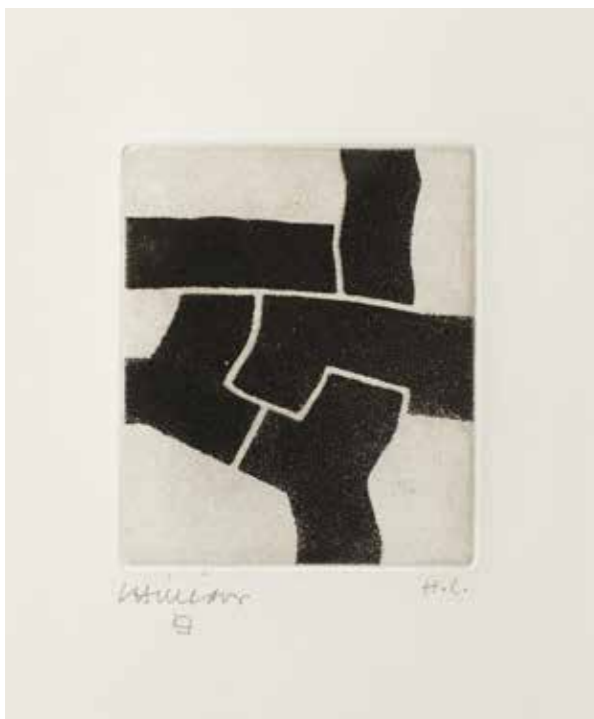
Eduardo Chillida, Zapatu (Premsar) , 1972. Aiguatinta sobre paper Japó collé sobre Arches. P. 11 x 9,3 cm. Pp. 57,5 x 50 cm.

És un artista inquiet, creador dels seus propis forns per coure i neveres per congelar per tal d'acon-