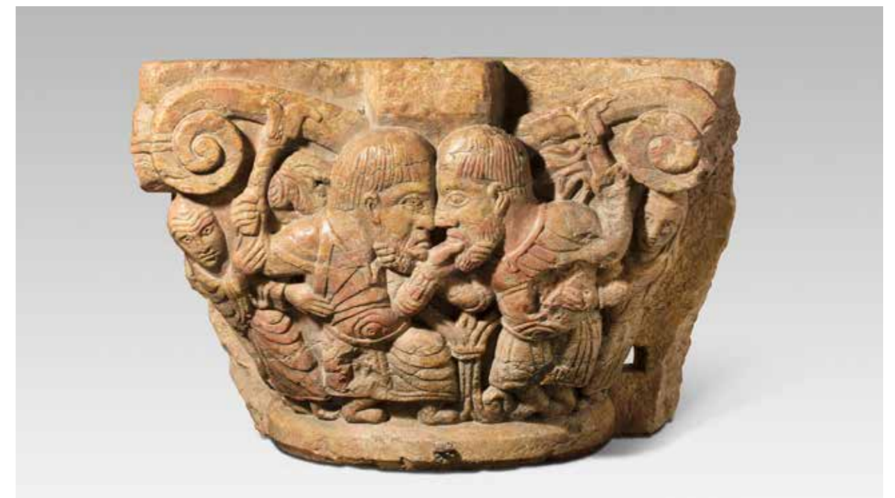
Capitell “ La disputa ”, Rosselló, S. XIX. Marbre rosa, 40 x 59 x 36 cm.