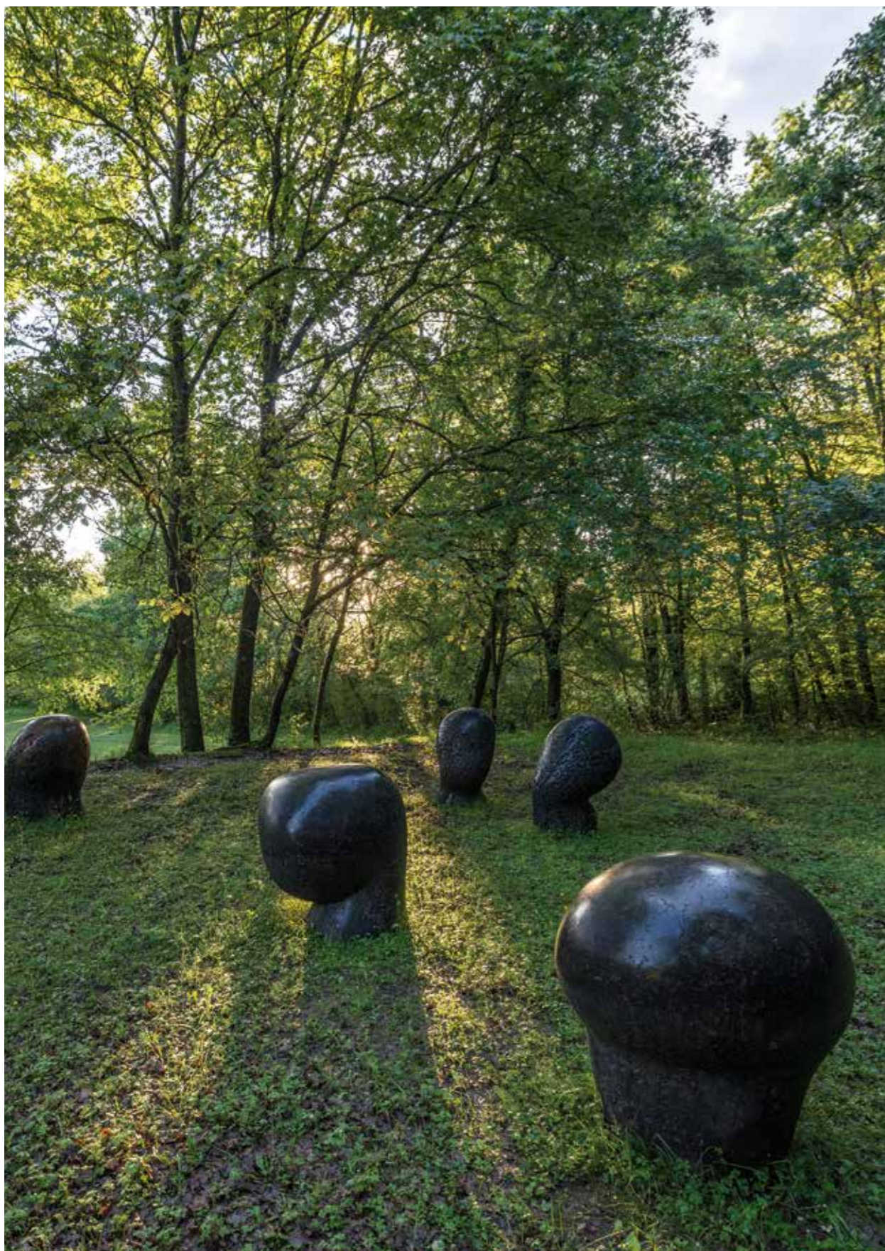
Claudi Casanovas. Pomones i Lluna Nova . 2013. Gres. 86 cm diàmetre, 90 cm alt.