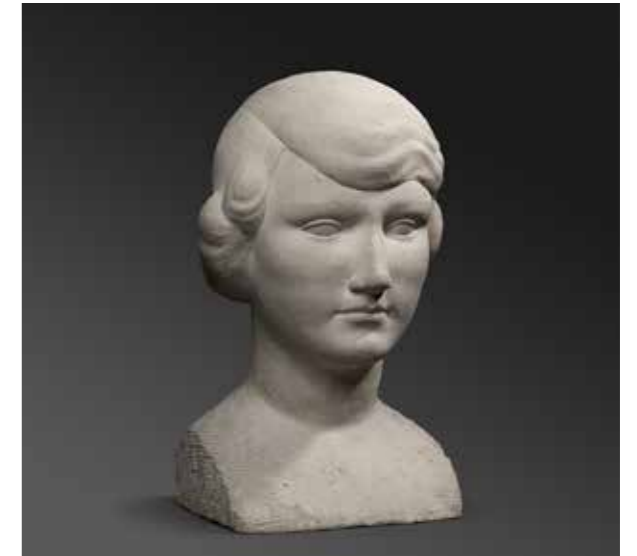
Enric Casanovas, Bust femení , c. 1930. Pedra, 39 x 25 x 25 cm.

Durant el 2013, el període del qual partim en aquesta exposició, a la seva obra hi ha una reaparició del tema antropomorf de l'ull i del cap. Creades en les sèries Lluna nova , Pomones , Les Callades , Jardí imaginari i Quart Creixent , el ceramista s'inspira en obres d'altres artistes com el Jardí de saló , realitzat per Llorens i Artigas (algunes peces d'Artigas seran presents a l'exposició a la galeria) en col·laboració amb l'arquitecte Nicolau Maria Rubió i