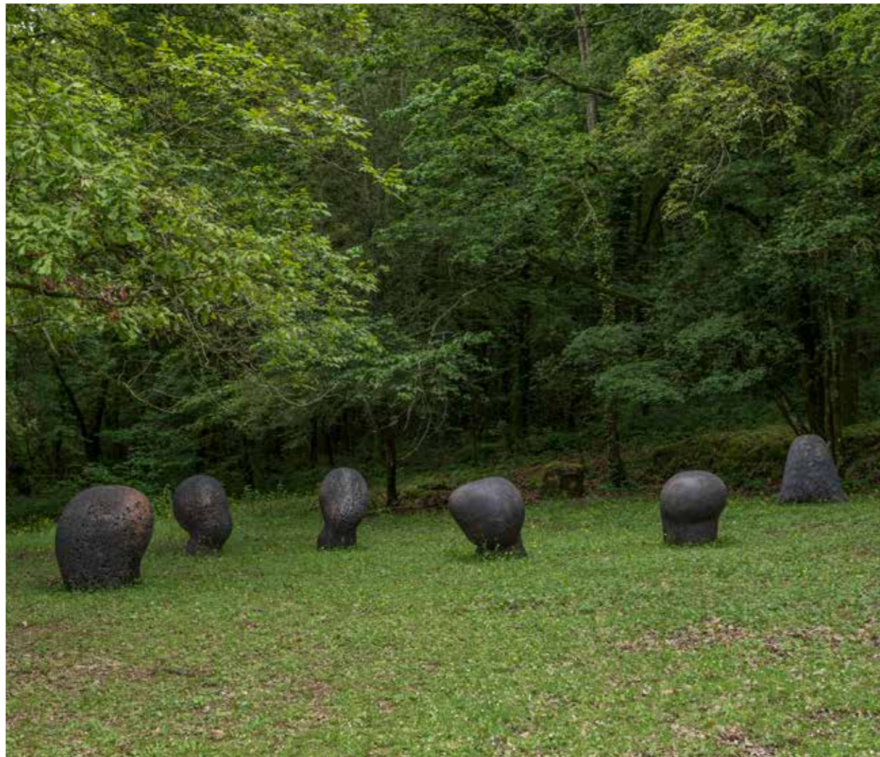
Claudi Casanovas. Pomones i Lluna Nova . 2013. Gres. 86 cm diàmetre, 90 cm alt.

L'Art és el que resta al fi de cada etapa del camí, mai no depèn de nosaltres.