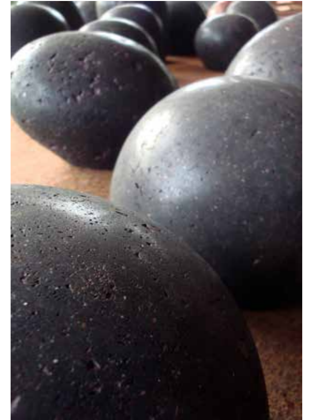
Claudi Casanovas, Jardi Imaginari , 2014. Gres, 20 x 20 cm.

Actualment, té obra en diverses galeries, sobretot de Londres com la Erskine Hall & Coe.